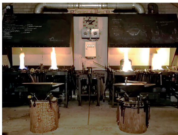
Praktijklokaal smederij De Waard.

Na te hebben aangetoond dat je de verschillende onderdelen van de cursus op een goede wijze hebt doorlopen krijg je een certificaat van deelname. Met deze cursus als bagage ben je al in staat om zelfstandig te smeden. Daarna kun je jezelf verdiepen in verschillende smeedtechnieken, waardoor het je steeds beter lukt om ingewikkelde werkstukken, zoals diverse gereedschappen, te maken. Want al doende leert men! Wil jij ook deze toffe cursus volgen? Mail dan naar smederijdewaard@gmail.com